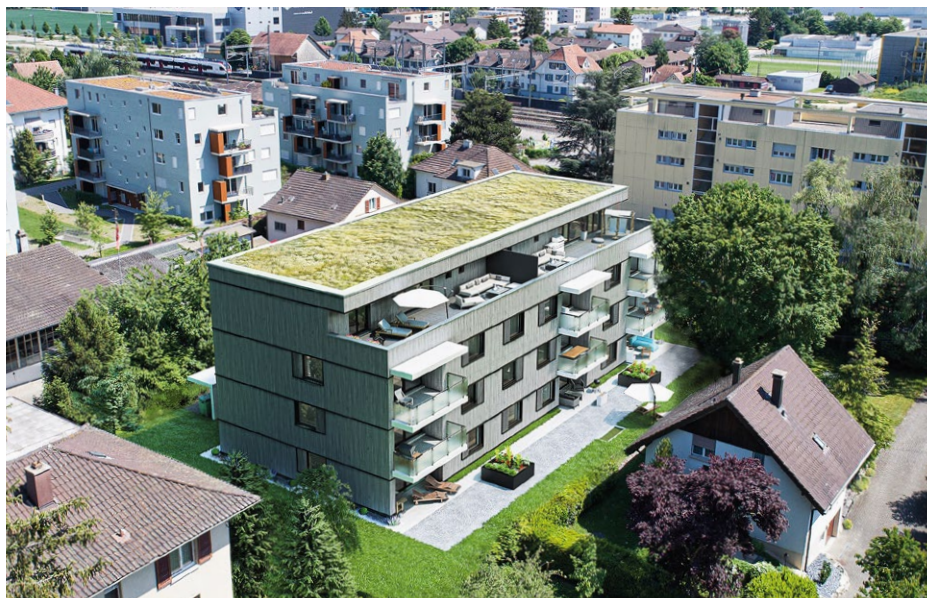
↑ Modern und zweckmässig: Der Neubau bietet flexible Nutzungsmöglichkeiten.

In den vergangenen Jahren sind in der rodania mehrere Büroräume zu Zimmern für begleitete Menschen geworden. Im Neubau sind daher auch mehrere Büros für leitende Mitarbeitende vorgesehen. Und die auf einem Geschoss zusammengelegten Sitzungsräume stehen sowohl für eine interne als auch externe Nutzung zur Verfügung. Ebenfalls zum Raumangebot gehören zwei Entlastungszimmer für Klientinnen und Klienten der Institution sowie für externe Gäste. Im 3. Obergeschoss stehen zusätzlich eine 3½- und eine 5½-Zimmer-Wohnung für externe Feriengäste zur Verfügung.