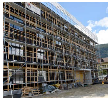
↑ Der Bau nimmt gestalt an.

Wir konnten intern auf viel Knowhow und Ressourcen von Mitarbeitenden zurückgreifen, welche bereits im Bereich Kommunikation und Fundraising gearbeitet haben. Ausserdem hatten wir aufgrund der Corona-Situation und vielen abgesagten rodania Anlässen intern auch Zeit, das gesamte Projekt selber zu organisieren und zu begleiten. Und nicht zuletzt